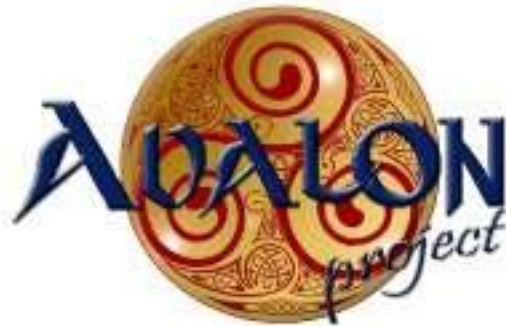
Iniciativa para una Cultura de Paz